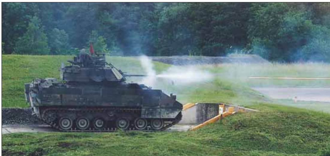
M2A2 střílí na cíl v rámci kvalifikace, Grafenwöhr, Německo. Hlavní podpora mechanizované pěchoty, BFV slouží průběžně v městských a tradičních bojových operacích, včetně významných doprovodných ochranných misí. Mnohé mají pro operace v Iráku změněný evropský maskovací nátěr na žlutohnědou barvu pouště.

20 let, avšak má nedostatek let odsloužených ve třídě nutných k převedení do třídy 6.