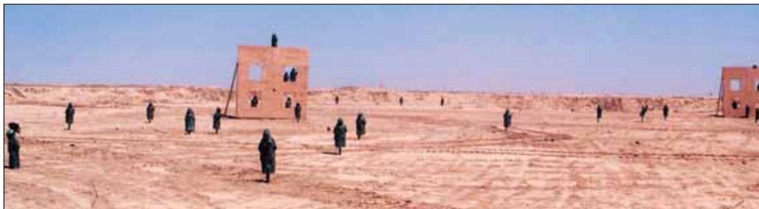
Cíle ve výcvikovém komplexu střelnice pro ruční zbraně Butler Range. Plocha 56 km 2 je rozčleněna do osmi různých pásem, aby bylo možné využít všechny základní zbraně s použitím tanků, dělostřelectva a bitevních vrtulníků. Při zahajovacím ceremoniálu bylo toto zařízení pojmenováno Butler Range po vojákovvi 1. obrněné divize, seržantu Jacobu Butlerovi, který padl ve službě během vojenské operace v Iráku. V současné době je stále v provozu.

Normální kariérový vzor pro narukované muže a ženy kombinuje časová období nasazení v rámci specializace i mimo ni. Je prováděn pokročilý výcvik podle specializace nebo všeobecný výcvik – tj. kurzy pro velitele a poddůstojníky (NCO) – a vojáci jsou podněcováni ke získávání civilního vzdělání prostřednictvím